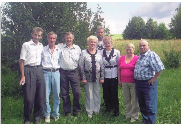
Встреча одноклассников через 40 лет после окончания школы, 2004 г.

Вот и встретились мы на причале родном, Где до боли нам всё знакомо и близко, Мы по нашим заветным тропинкам пройдем, Повзрослевшим берёзкам поклонимся низко.